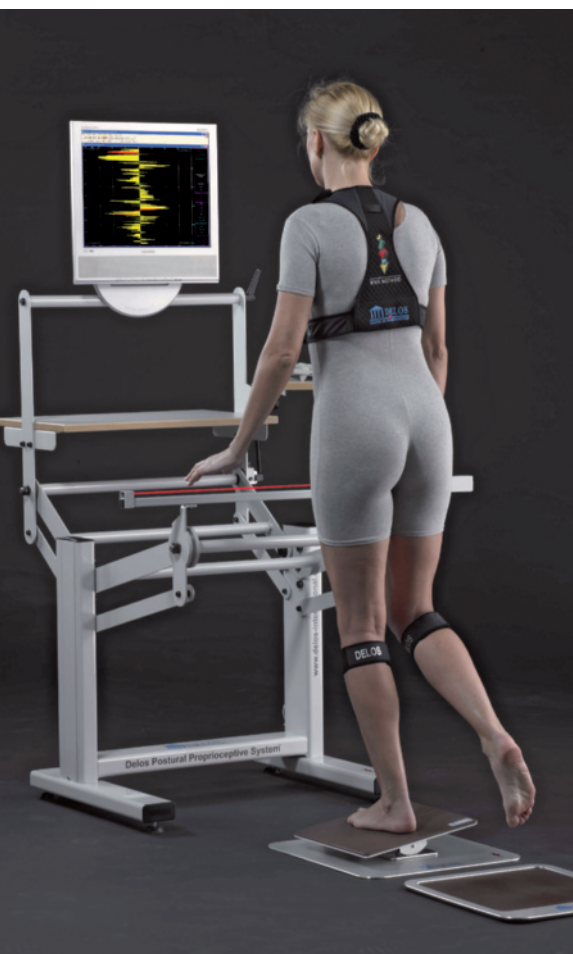
Esecuzione del test di Riva dinamico. La linea rossa indica la presenza del sensore infrarosso per l'appoggio delle mani

Le differenti tipologie d'appoggio (monopodalico, bipodalico e da seduto), i diversi orientamenti (latero-laterale, antero-posteriore e